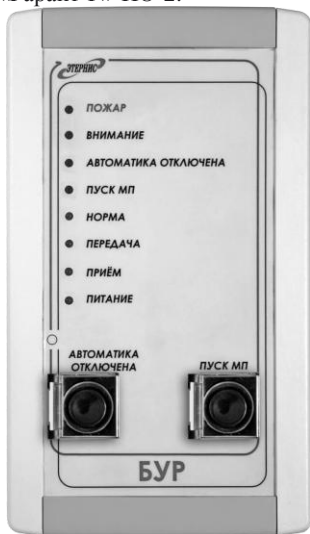
Рис. 1. Внешний вид «БУР»

4.2. Внешний вид «БУР» приведён на рис. 1, а внешний вид кронштейна крепления, с помощью которого «БУР» устанавливается на стене помещения – на рис. 2. Расположение индикаторов, органов управления и разъемов приведено в Руководстве по эксплуатации АУП «Гарант-Р» ПО-2.